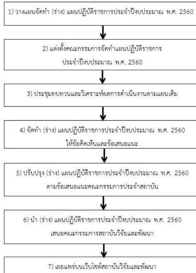
ภาพที่ 2.1 แสดงขั้นตอนการจัดทำ แผนปฏิบัติการ ปีงบประมาณ พ.ศ. 2560

2.1 ขั้นตอนการจัดทำ แผนปฏิบัติการประจำปีงบประมาณ พ.ศ. 2560 สถาบันวิจัยและพัฒนา ประกอบด้วยวิธีปฏิบัติงานในแต่ละขั้นตอนที่สำคัญ ดังนี้ (ดังภาพที่ 2.1)