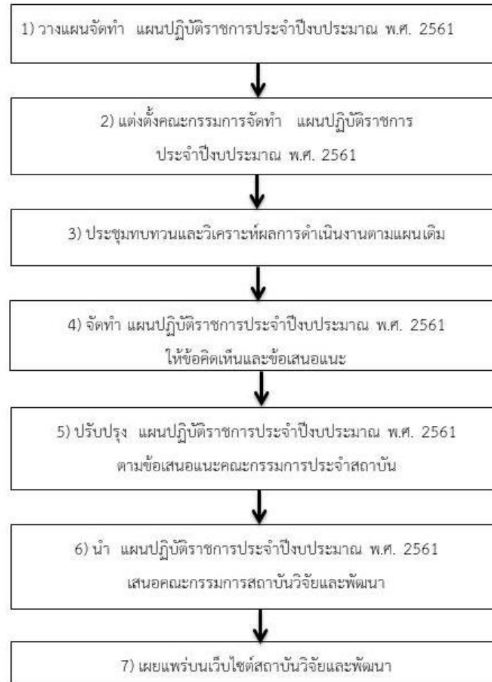
ภาพที่ 2.1 แสดงขั้นตอนการจัดทำ แผนปฏิบัติการ ปีงบประมาณ พ.ศ. 2561

2.2 ขั้นตอนการจัดทำแผนปฏิบัติการ ประจำปีงบประมาณ พ.ศ. 2561 สถาบันวิจัยและพัฒนา ประกอบด้วยวิธีปฏิบัติงานในแต่ละขั้นตอนที่สำคัญ ดังนี้ (ดังภาพที่ 2.1)