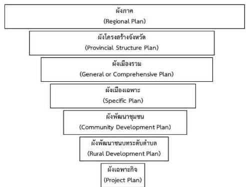
รูปที่ 2 แสดงผังประเภทต่าง ๆ ที่อยู่ภายใต้ความรับผิดชอบของกรมโยธาธิการและผังเมืองของไทย

กรมโยธาธิการและผังเมืองรับผิดชอบการวางผังประเภทต่างๆ 7 ประเภทโดยเรียงจากขนาดของพื้นที่และหน่วยงานที่รับผิดชอบ (ดังรูปที่ 2) จรัสศรี ทีปรีช อ่างในดำรงศักดิ์ จันทไทย [11]