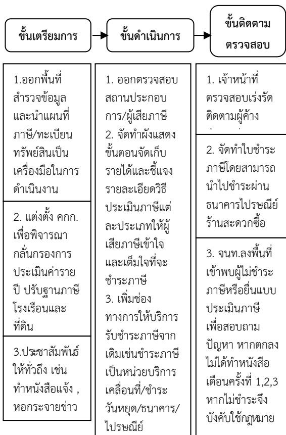
รูปที่ 2 ตัวแบบการจัดเก็บภาษีที่เหมาะสมของเทศบาลตำบลน้ำแซบ